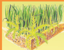
1. Przed zastosowaniem.

Azot (N) całkowity 15%, w tym amonowy 1,0, azotanowy 1,5%, amidowy 12,5%, pięciotlenek fosforu (P2O5) 5% rozpuszczalny w obojętnym roztworze cytrynianu amonu i w wodzie, 5 % rozp. w wodzie, tlenek potasu (K2O) 5% rozp. w wodzie, żelazo (Fe) 10,0% rozp. w wodzie.