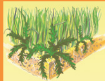
2. Po zastosowaniu.